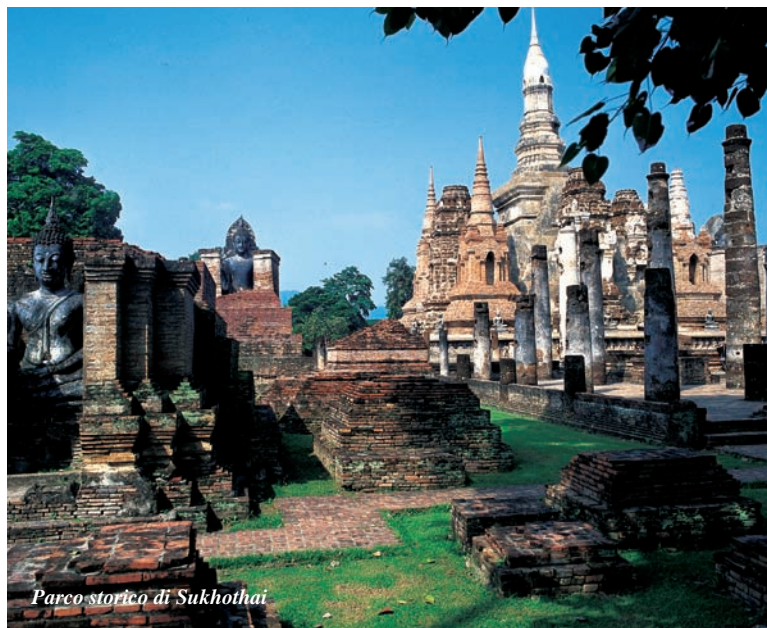
Parco storico di Sukhothai

A 56 chilometri verso il nord si trova Si Satchanalai, sito minore ma non per questo meno spettacolare: un gruppo di templi molto suggestivi sullo sfondo di colline verdeggianti.