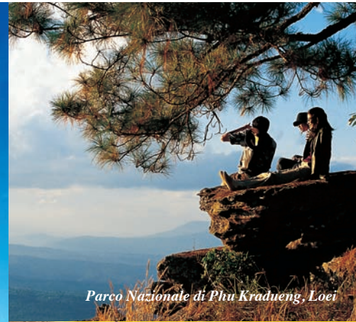
Parco Nazionale di Phu Kradueng, Loei