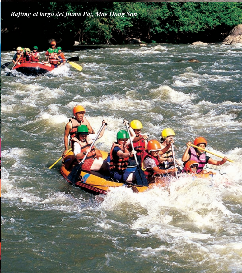
Rafting al largo del fiume Pai, Mae Hong Son