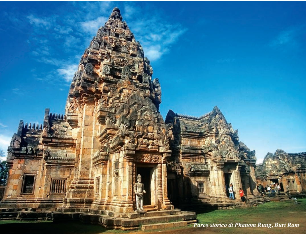
Parco storico di Phnom Rung, Buri Ram