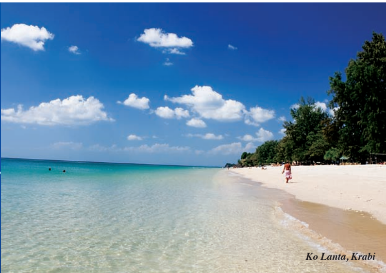
Ko Lanta, Krabi

Le rupi verticali di color ruggine, alcune delle quali arrivano addirittura a 1000 piedi, forniscono a posti così stupendi una vista impressionante. Inoltre, ci sono delle isole lontane dalla costa: tra le più famose ci sono le gemelle isole di Phi Phi, utilizzate come set del film The Beach , e l'isola di Lanta che è diventata popolare negli ultimi anni.