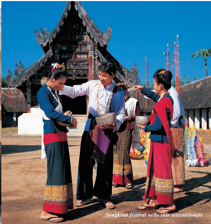
Songkran festival nello stile settentrionale

La bellezza naturale della provincia è degnamente rappresentata dal Parco Nazionale di Kaeng Krachan, la più grande area protetta della Thailandia che copre 2,920 km 2 di foreste pluviali e ospita circa 40 specie di mammiferi tra cui l'orso malese, l'orso nero asiatico, il leopardo, la tigre e l'elefante. Il Parco abbraccia anche i 45 km 2 della Riserva Naturale di Kaeng Krachan.