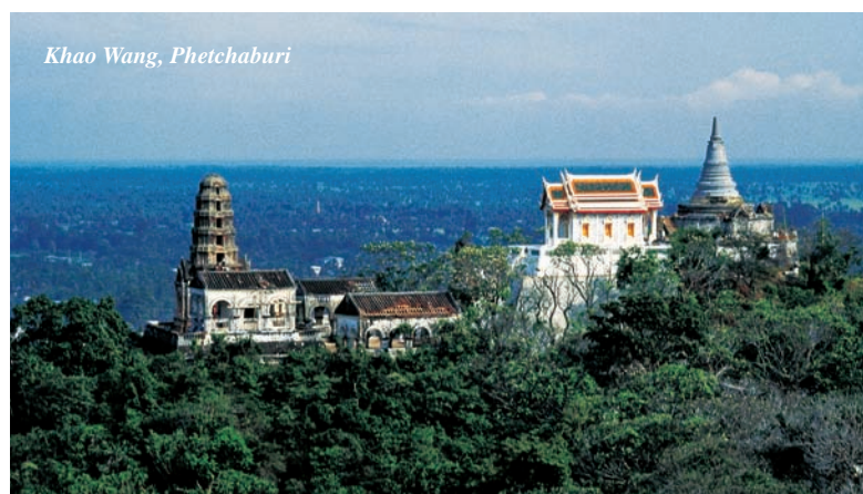
Khao Wang, Phetchaburi

A Ovest di Bangkok, dove si ergono i monti che fanno da confine naturale tra la Thailandia e il Myanmar, Kanchanaburi collega l'interesse storico ad alcuni scenari naturali tra i più pittoreschi dell'intera nazione.