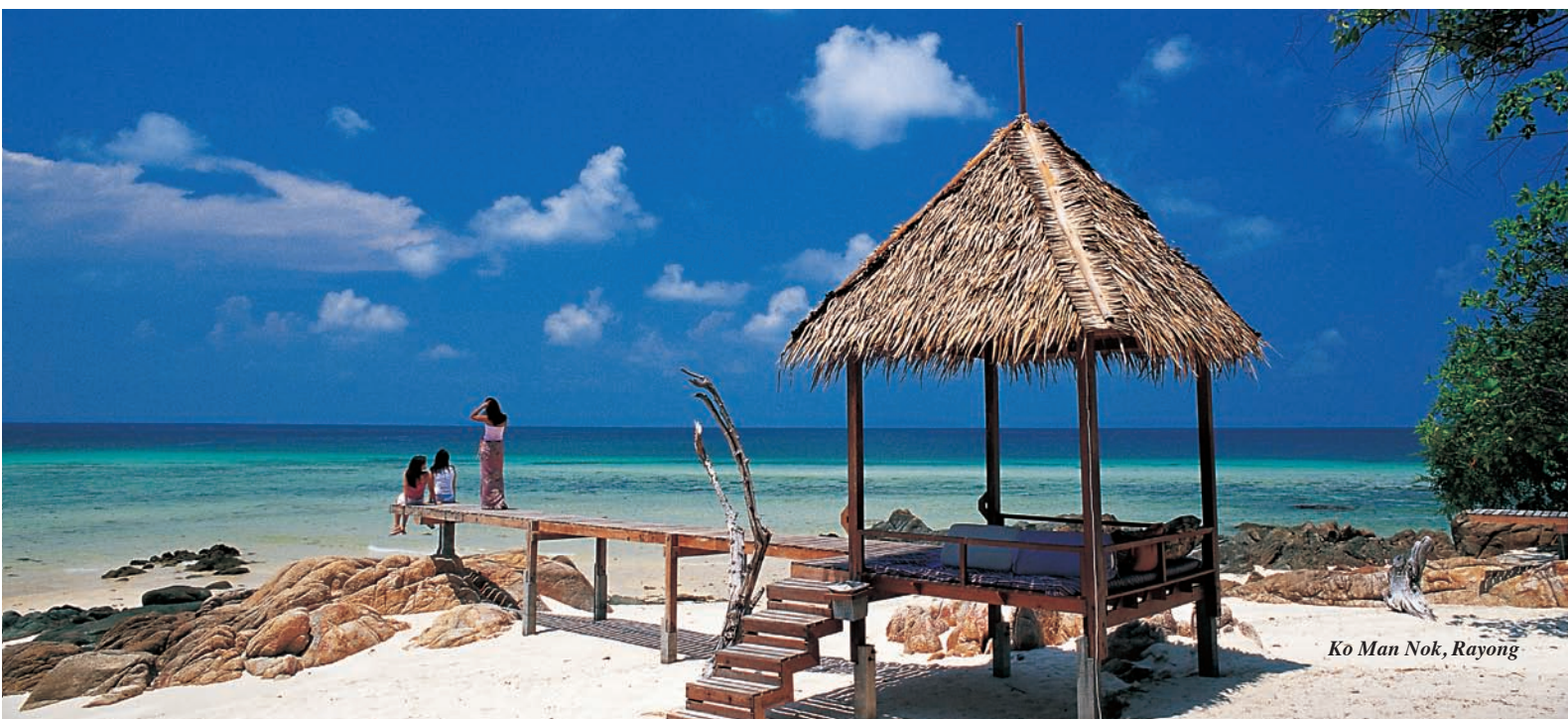
Ko Man Nok, Rayong

Sulla strada litoranea, la città di Rayong presenta due luoghi di interesse culturale: Wat Pa Pradu che custodisce una grande statua di Buddha sdraiato e Wat Lum Mahachai Chumpon in cui si trova un monumento che commemora il momento in cui Re Taksin, al comando del suo esercito, espulse dal regno l'esercito birmano dopo la caduta di Ayutthaya nel 1767.