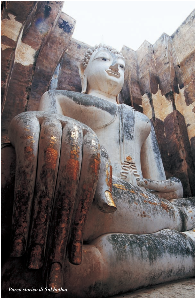
Parco storico di Sukhothai