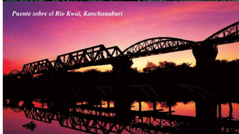
Puente sobre el Rio Kwai, Kanchanaburi