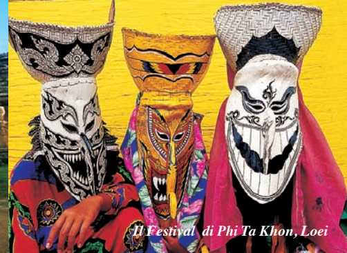
Il Festival di Phi Ta Khon, Loei