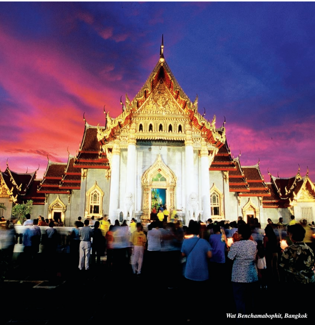
Wat Benchamabophit, Bangkok