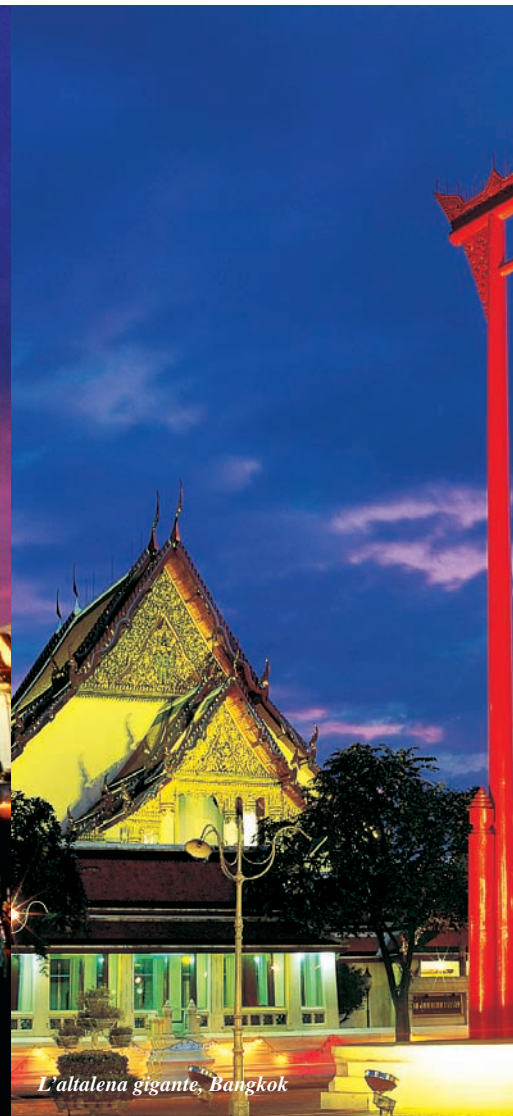
L'altalena gigante, Bangkok