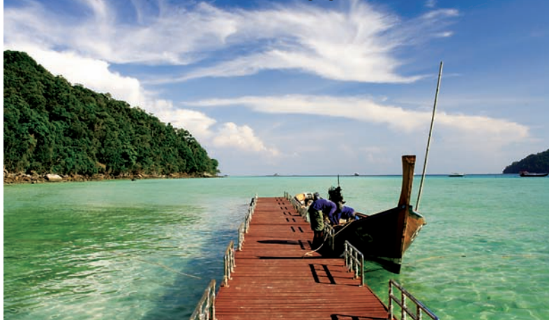
Parco Nazionale marino di Muko Surin, Phang-nga

Un luogo d'attrazione differente si trova di fronte alle spiagge a nord di Phang-nga, dove le acque intorno ai gruppi di isole di Similan e Surin presentano condizioni ideali per le immersioni, un mondo sottomarino brulicante di pesci tropicali e abbondante di barriere coralline che vi lasceranno senza fiato.